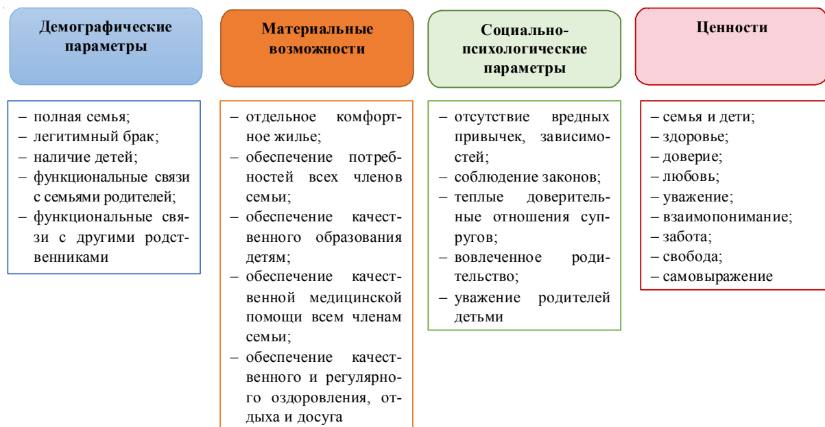
Рис. 2. Содержание понятия «Благополучная счастливая семья»

Вместе с тем существующие тенденции разводимости (33 % разводов происходит в первые 5 лет брака), исследования причин разводов и проблем семейной жизни свидетельствуют о необходимости выстраивания работы по сбережению брачных союзов, в том числе и в кругу многопоколенной семьи. Особого внимания требует пропаганда института многопоколенной российской семьи, где нео-